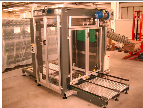
Vista dell'Impilatore MC28/A View of the MC28/A stacking machine